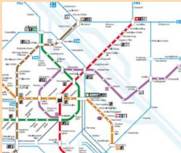
Hirschstetten – öffentliche Verkehrsanbindung: